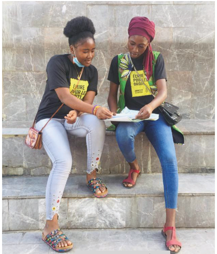
Frá PITT NAFN BJARGAR LÍFI í Benín, 2020.

Mannréttindi eru ekki munaður sem fólk fær aðeins að njóta þegar aðstæður leyfa.