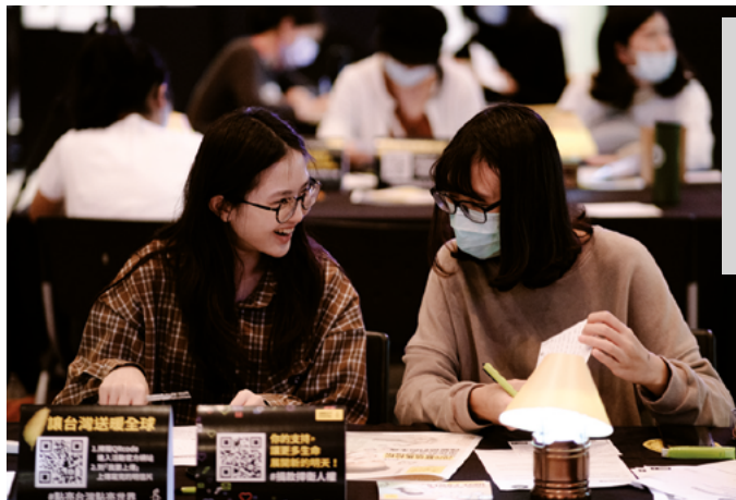
Frá PITT NAFN BJARGAR LÍFI í Tævan, 2020.

Í ár beinir herferð Amnesty International PITT NAFN BJARGAR LÍFI sjónum að einstaklingum sem sætt hafa mannréttindabrotum fyrir friðsamlegt aðgerðastarf eða sýn sína á lífið. Málin snúa til dæmis að hinsegin aðgerðasinnnum, umhverfissinnnum og friðsamlegum mótmælendum. Einstaklingarnir sem um ræðir hafa ýmist sætt ofbeldi, skotárásur, fangelsisvist, ofsóknum eða hótunum. PITT NAFN BJARGAR LÍFI verður til þess að þessir þolendur mannréttindabrota fá stuðningskeðjur í þúsundtali frá fólki frá fjarlægum heimshornum. Þolendurnir og fjölskyldur þeirra finna að mál þeirra er ekki gleymt þar sem vakinn er opinber athygli á málunum víða um heim.