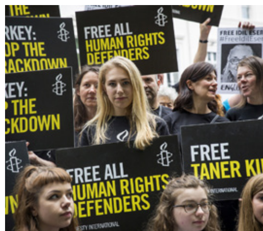
Mótmæli fyrir utan sendiráð Tyrklands í London, Bretlandi 12. Júlí 2017.

Með starfi okkar verndum við fólk og valdeflum það, allt frá afnámi dauðarefsingar til baráttu fyrir kynfrelsi og frelsi til barneigna og allt frá baráttu gegn mismunum til að verja réttindi flóttamanna og farandfólks. Við stuðlum að því að aðilar sem beita pyndingum verði færðir fyrir rétt. Við reynum að fá lögum sem stuðla að kúgun breytt og við berjumst fyrir frelsi fyrir fólk sem hefur verið fangelsað fyrir það eitt að segja skoðun sína. Við tökum málstað allra, sama hver uppruni þeirra er, sem búa við skert frelsi eða mannvirðingu.